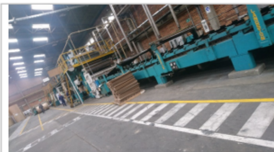
Foto No.1 Instalaciones de la sociedad comercial EMPAQUES INDUSTRIALES DE COLOMBIA

La sociedad comercial LATINOAMERICANA DE CORRUGADOS Y EMPAQUES S.A.S. se encontraba ubicada en el predio con nomenclatura urbana Calle 22 D No. 120 – 19 de la Localidad de Fontibón, se realiza visita técnica el día 11 de octubre de 2018 con el fin de verificar el estado ambiental de las actividades desarrolladas y el cumplimiento normativo.