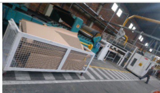
Foto No. 2. Instalaciones de la sociedad comercial EMPAQUES INDUSTRIALES DE COLOMBIA